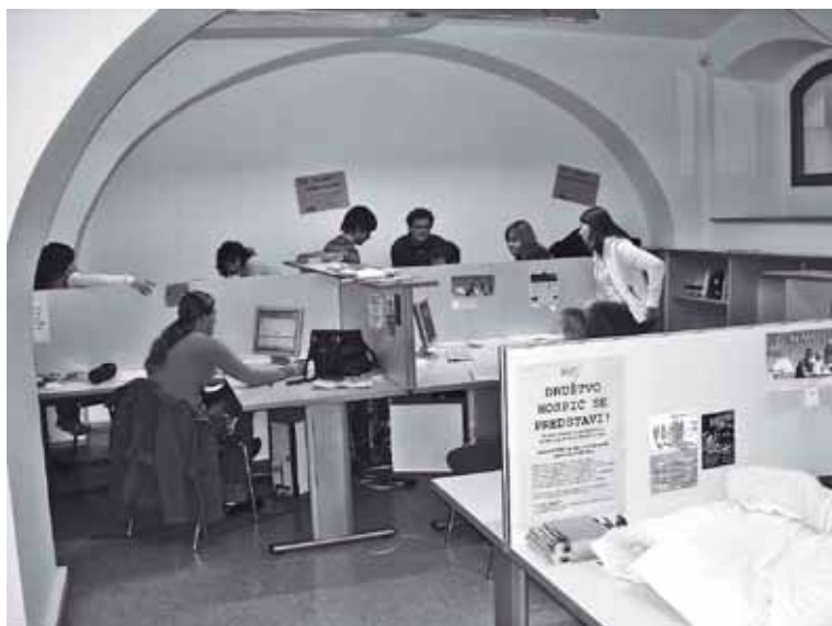
V študentski sobi je vselej živahno