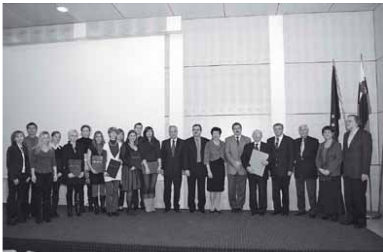
Nagrajenci ob dnevu fakultete decembra 2009 z dekanom in prodekani