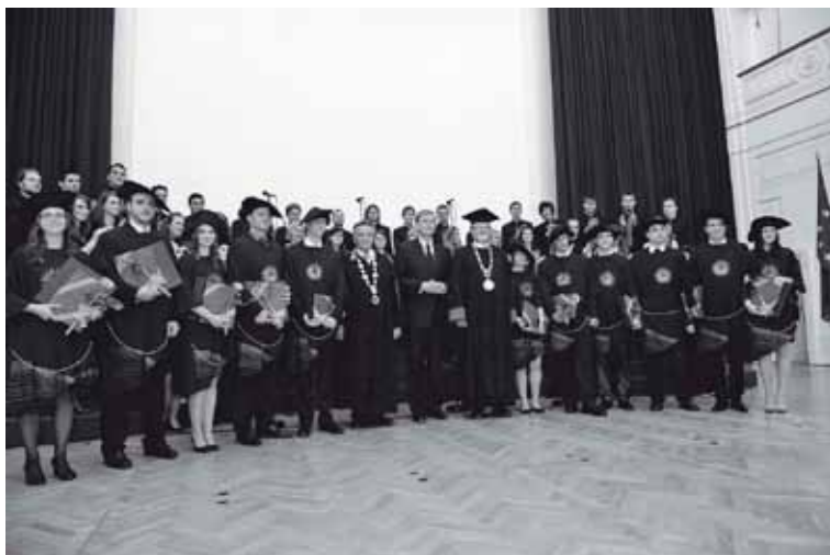
Prvim diplomantom je diplome izročil predsednik Republike Slovenije dr. Danilo Türk