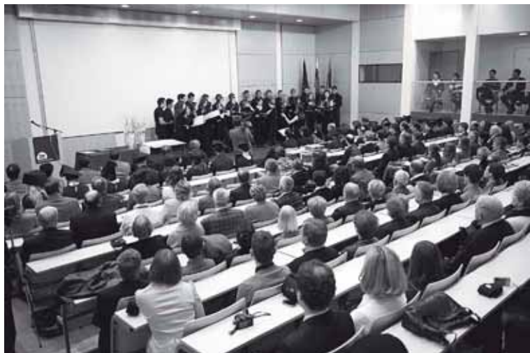
Slovesnost ob dnevu Medicinske fakultete 2010