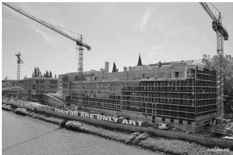
Dela na novogradnji Medicinske fakultete potekajo po načrtih