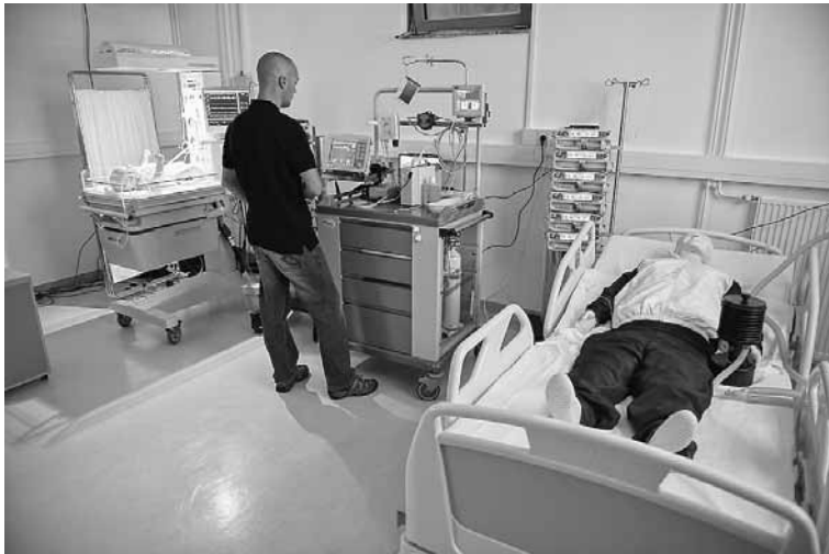
Delo v simulacijskem centru