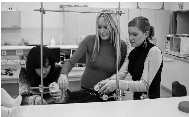
Vaje v laboratorijskem centru