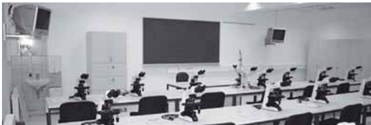
Na inštitutu za anatomijo

Žal bi mi bilo, če Erasmus izmenjave ne bi izkoristila.